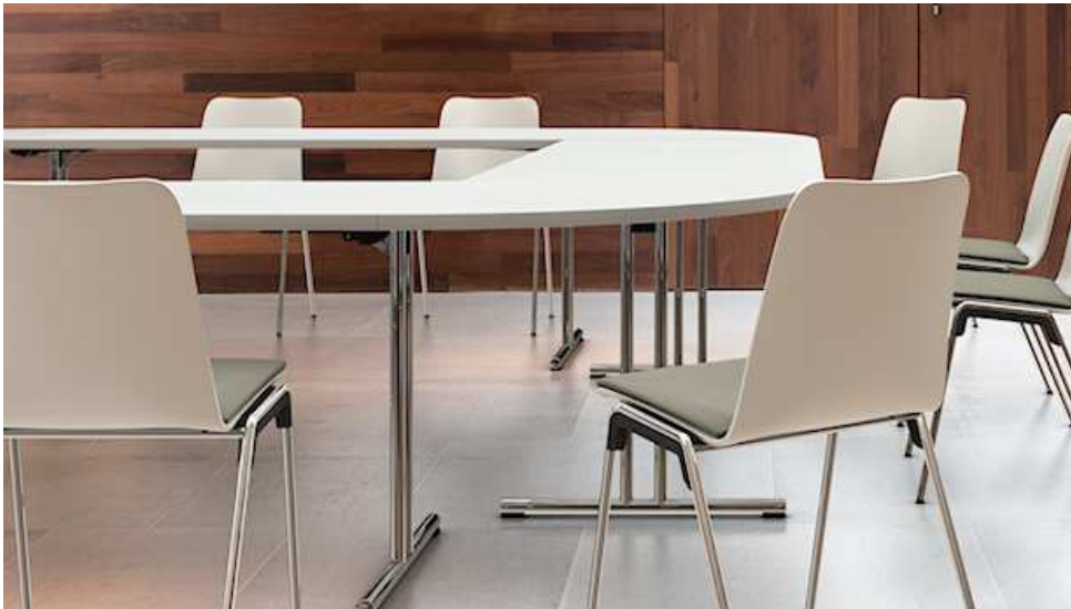
BS9 a BS10:

skládací stůl 1400x800x740 mm , stohovatelný a přídavný roh 800x800 mm, materiál: podnož - chrom, sklopný mechanismus, kování na zavěšení rohu, odlehčená deska 30 mm, laťovka s DTD, povrch HPL tl. 0,8 mm, barva bílá,